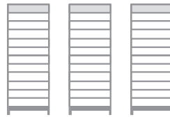
LITEIN 82.5 x 3